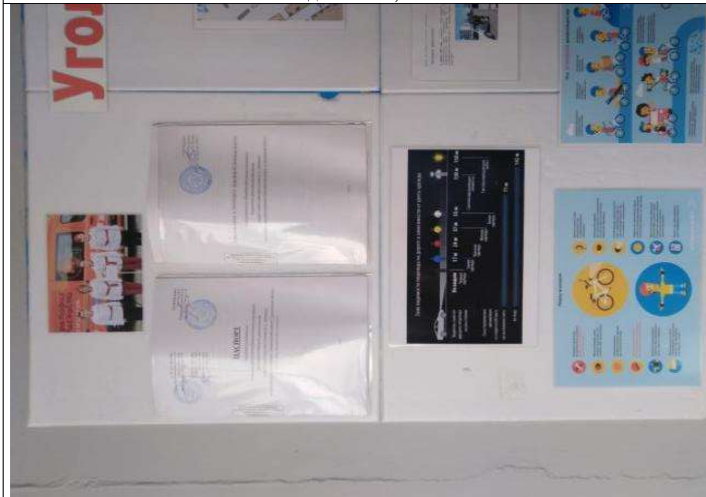
Здания №1, №2.